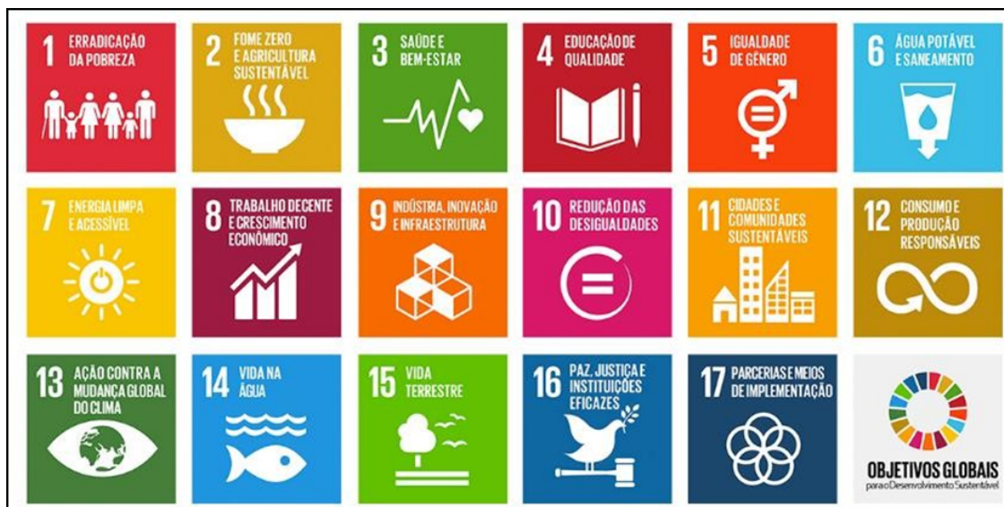
Figura 1 - Objetivos de Desenvolvimento Sustentável (ODS) estipulados pela ONU.

ODS 17 – Parcerias e meios de implementação: Reforçar os meios de implementação e revitalizar a parceria global para o desenvolvimento sustentável.